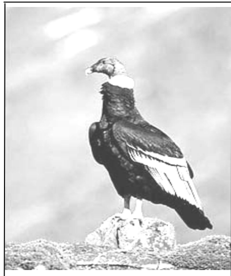
El cóndor hembra

7 La hembra pone uno o dos huevos en el nido. El huevo de un cóndor se tiene que empollar por aproximadamente dos meses, y el padre y la madre se turnan en esa tarea. Cuando nace el pichón, ambos padres lo cuidan. El pichón de un cóndor requiere mucho cuidado de sus padres porque no puede volar hasta